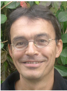
von Christian Schwaiger, BL-AHS-Gew., schwaiger (a) oeli-ug.at